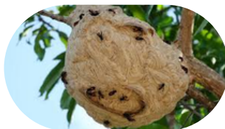
Nid de frelons