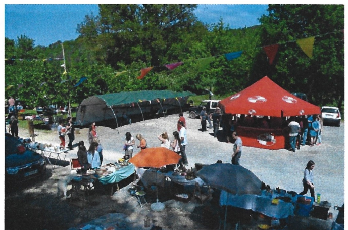
le concours de pêche et le vide-grenier du dimanche