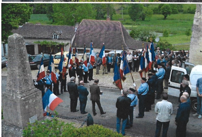
Le dépôt de gerbe et les discours