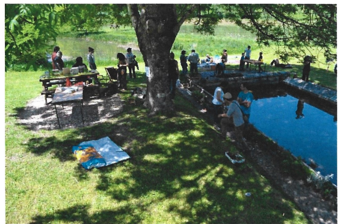
la bourse aux plantes et les jeux proposés par le Club CPN