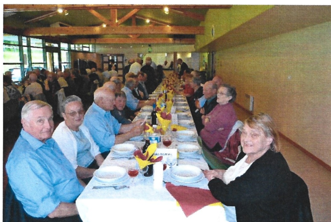
L'apéritif offert à l'issue de la cérémonie et le repas organisé par l'association des anciens combattants