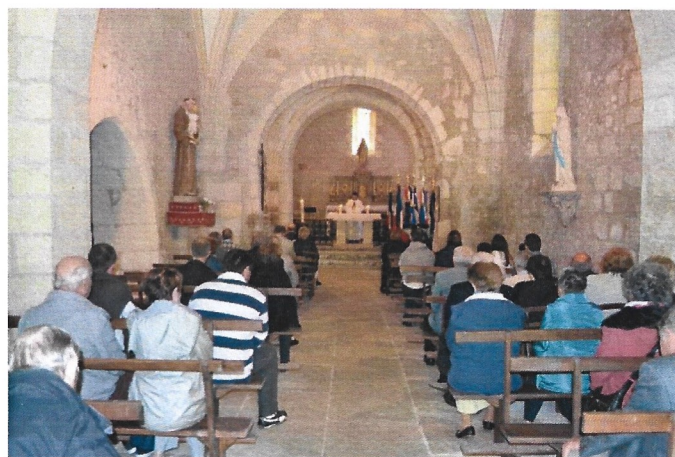
La cérémonie religieuse à l'église