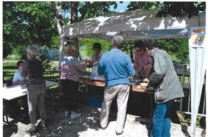
le barbecue, les frites et les casse-croûtes