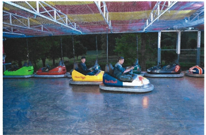
le rampeau, le repas et les manèges