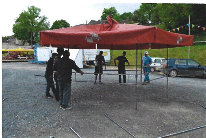
l'installation par l'équipe du Comité des Fêtes