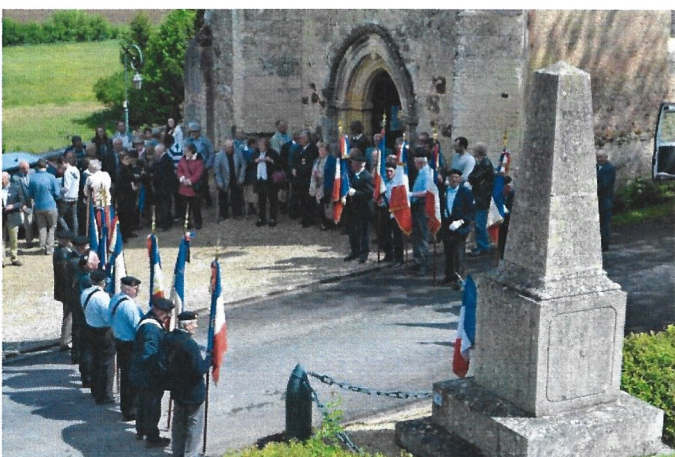
La sortie de la messe