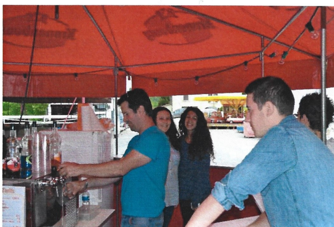
le concours de pétanque et la buvette du samedi