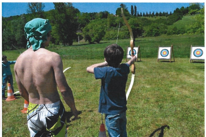
le canoë, le tir à l'arc et la participation du groupe « Les abeilles bergeracoises »