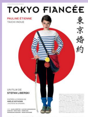
Tokyo fiancée mardi 28/04 à 20h30