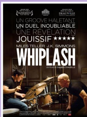
Whiplash mardi 14/04 à 20h30