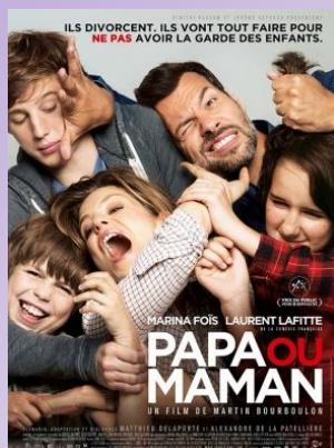
Papa ou maman mardi 31/03 à 20h30