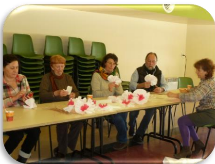
Réalisation des fleurs à Saint-Geyrac

Plus d'information sur : https://fr-fr.facebook.com/PecheursautourduMonde