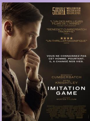
Imitation Game (VO) mardi 17/03 à 20h30