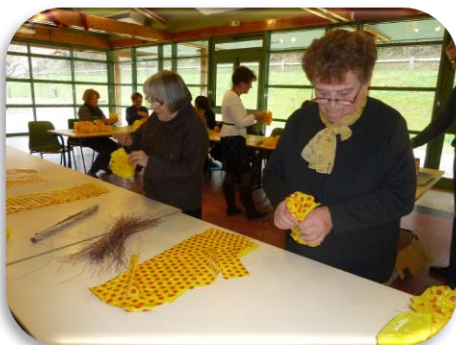
Réalisation des fleurs à Saint-Geyrac