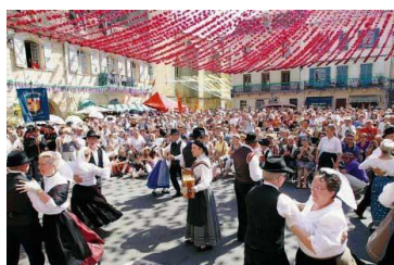
FELIBREE 2015 à La Douze